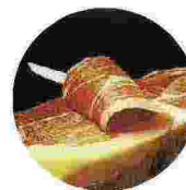
Giunge alla quarantottesima edizione la Sagra del Prosciutto di Bassiano . Spettacoli, eventi e tanta gastronomia per gli amanti del pregiato alimento proposto in tutte le intriganti varietà