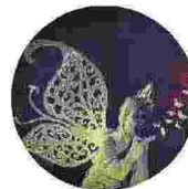
Siete pronti per uno degli appuntamenti più attesi dell'anno? I Fasti verolani stanno per iniziare!